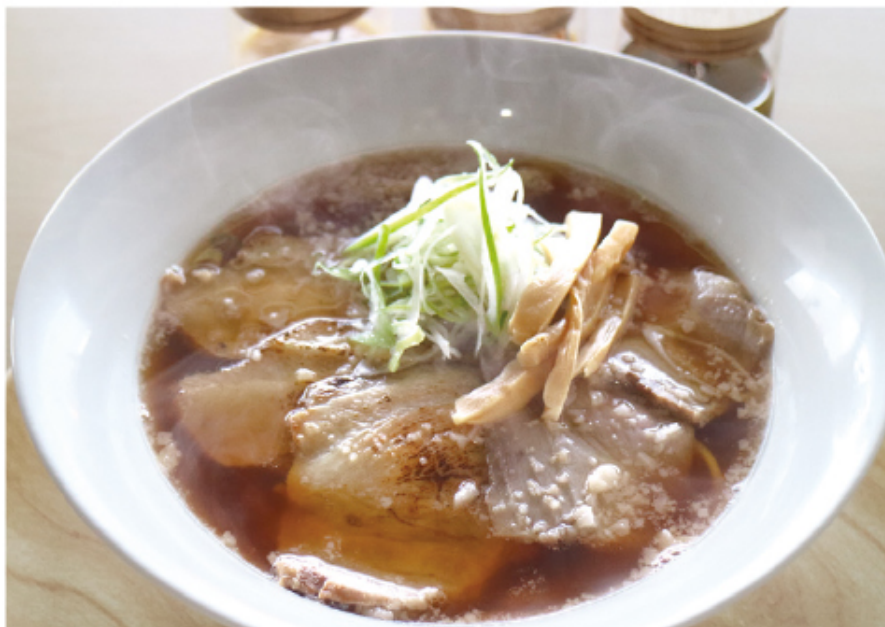
▲一番人気のチャーシューメン/900円

今年3月にオープンした「鈴や」のラーメンはクセのないやさしい味わいで、背脂が入ったスープに中太麺が絡み、チャーシューは食べ応えのある厚切り。これだけでも絶品なのだが、最大の特徴は、フライドガーリック、ペッパー、柚子の3種のオイル。お好みで回し入れれば、ガツンとパンチの効いた味変となり最後まで風味が続く。この新しいラーメンスタイル、是非お試しあれ。