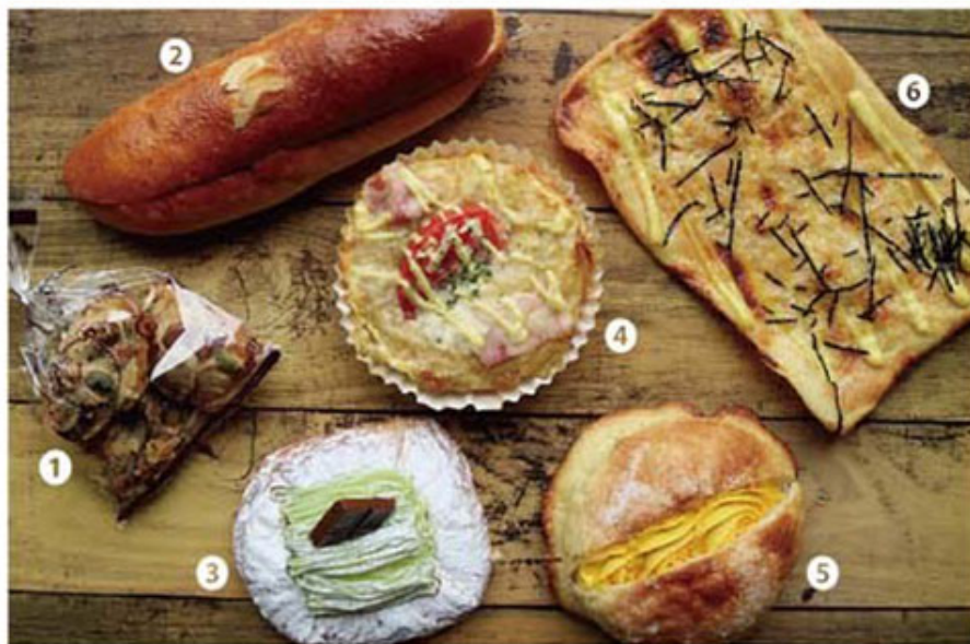
一番人気の⑥パリパリ明太子/200円 ▲

リーズナブルで美味しいパンを作り続けて30年の「ピーターパン」。「パリパリ明太子」の明太子を博多からの取り寄せるなど、全国から納得のいく素材を集めて独自の味を追及しており、季節の果実を使ったホイップクリームやカスタードクリームは自家製ならではの味わいとやさしい甘さが人気。「生クリームBOX」や「塩メロンぱん」など、新しい美味しさも発見できる。8の付く『パンの日』のサービスを目指してくるお客さんも多い。