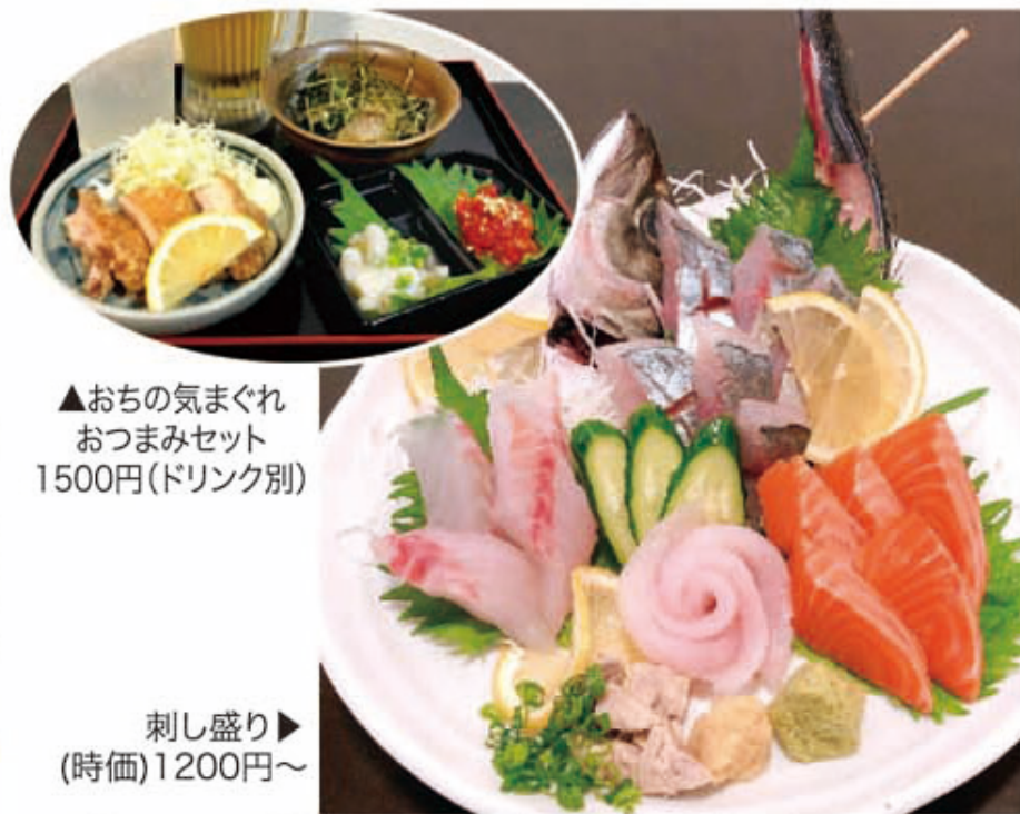
▲おちの気まぐれ おつまみセット 1500円(ドリンク別)