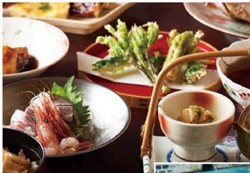
▲個室でゆったり旬の料理を堪能!

6月10日から旅館営業【日帰りプラン】を再開。食事と休憩は個室利用で、のんびり4時間くつろげるお得なプラン。地元食材にこだわった四季折々の郷土料理は、素朴さのなかに食材が持つ本来の味わいがあると地元客にも高評。一日2組限定なのでご予約はお早めに。鶴岡市のプレミアム商品券も利用可能。