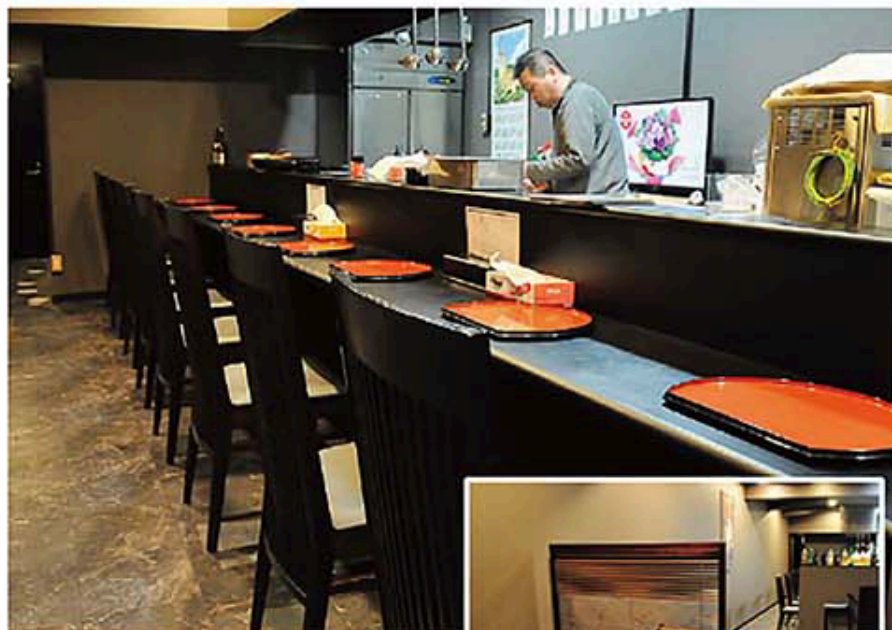
▲カウンター8席 小上がり2卓

現在の場所にオープンして3年、昔からの常連さんも多いやきとりの専門店。14種類のやきとり以外でのオススメ品は、時間をかけて煮込んだ“もつ煮込み”で早い時間に売切れることもある。基本的にやきとりをメインにしているので、料理の付いた宴会プランや飲み放題コースなどは用意されていない。