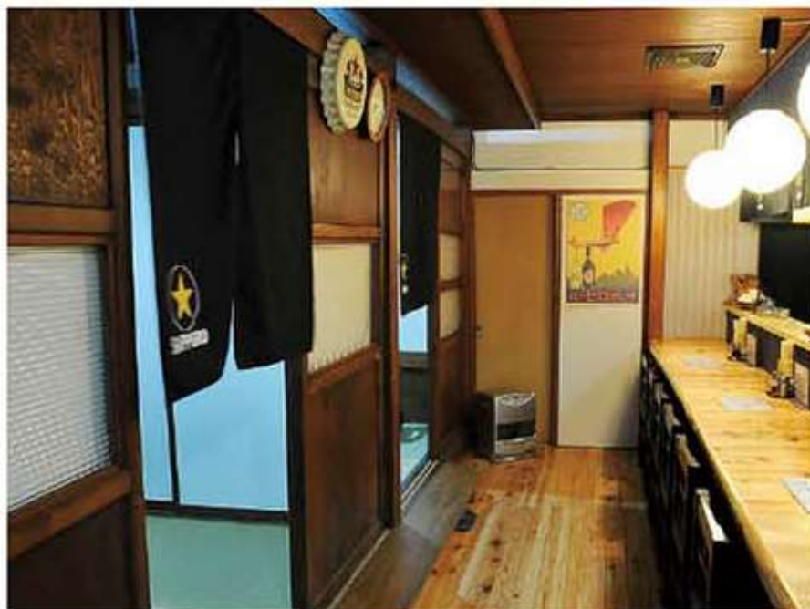
▲心地良い昭和感が漂う店内はカウンター6席と個室3室

昭和時代の昔風の居酒屋をイメージし、あえて大衆酒場の文字を冠した。料理のジャンルにこだわらず、旬の食材を使い季節感のある料理を提供している。材料さえあればメニューにない料理のリクエストに応じてくれることも…。また、カレーライスに汁物など酒を飲んだ後に、食事で来店するお客様も多い。