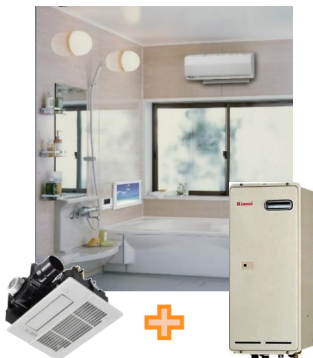
浴室暖房乾燥機 Rinnai RBH-C338K1DP