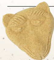
代々伝わる「ぎつねめん」

代々伝統を守り続けてきた、職人の魂が築き上げてきたと言っても過言ではないでしょう。