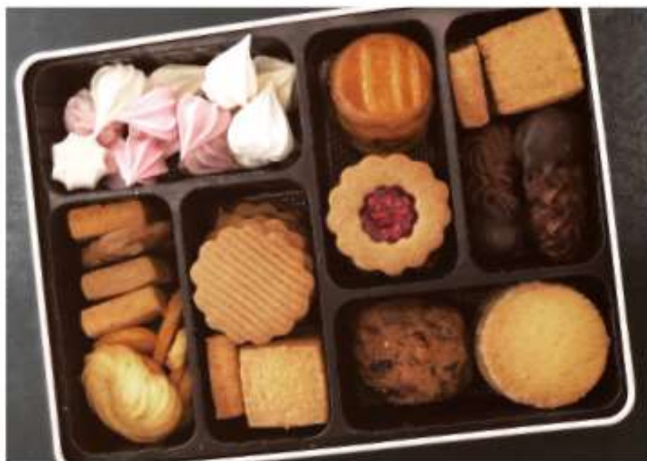
▲プティフルセック/3,618円

鶴岡で人気の洋菓子店、オーボナクイユ(おもてなしの意)。その名の通り、店頭にはパティシエの経験や技術を存分に込めた美しくおいしいお菓子が並ぶ。毎年2月下旬に発売する焼き菓子詰め合わせ「プティフルセック」はホワイトデーの贈り物としても人気。Instagramではこだわりの材料やお菓子のストーリーと共に限定品の発売が告知されるのでお見逃しなく。